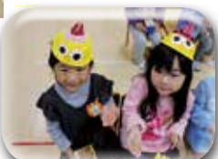
歳の数だけ豆を食べるよ♪