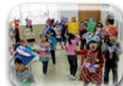
鬼は～外！ 福は～内！ 怖いけど頑張れ！