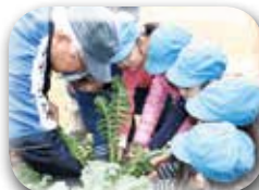
うんとこしょ！ どっこいしょ！