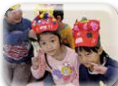
今から鬼退治！！ 頑張ります！！

2月3日は節分の会。この日は、子ども達の大キライな 怖い鬼が来る日で、朝からドキドキしていた子ども達。 心の鬼を退治できるかな～？