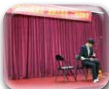
中国人二胡演奏者の方がオイスカ 幼稚園に来てくれました！