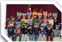
鬼と一緒にハイチーズ！ 後ろを振り向くと。。