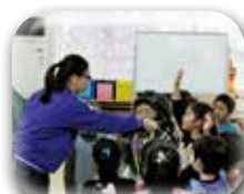
イントロクイズをしたよ！