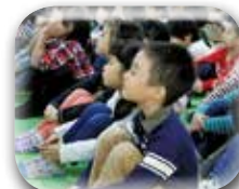
最後に子ども達からの 感謝の気持ちとしてメ ダルのプレゼント☆彡