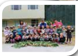
皆で力を合わせて 収穫出来たよ～☆