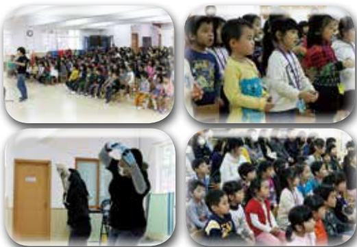
子ども達と手遊び歌も歌って頂きました！！ コーラスの皆様、本当にありがとうございました！！

1月14日に幼稚園のホールにとっても すてきな歌声が響き渡りました！ 子ども達も思わずうっとり... 楽しかったね！