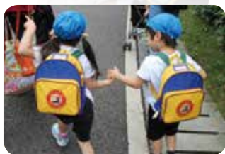
お友達と手をつないで 仲良く歩くと♪