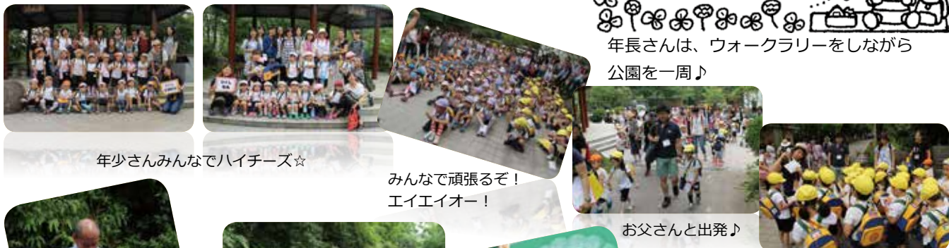
年少さんみんなでハイチーズ☆