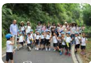
頑張ってるよ～！ バシヤリ☆