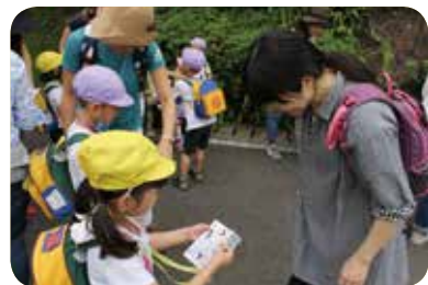
色々な文字を探すよ！