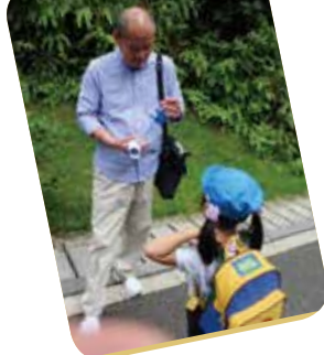
園長先生と何のお話 してるのかな～？