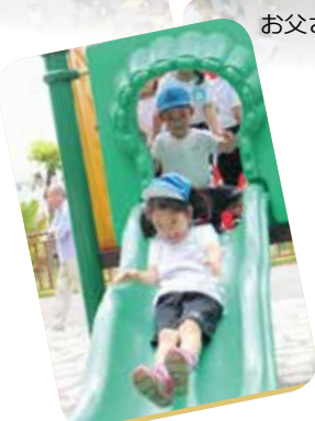
途中の公園で すべり台♪