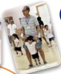
年中さんは、お父さんとウクレレを作りました！