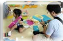
年長さんはロケットを作りました！