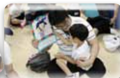
パパ喜んでくれたね！みんな嬉しそう！良かったね♪