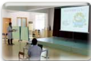
さあ、これから虫歯の話聞くよ！