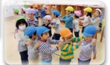
皆大好きジャンケン列車! 最後に勝つのはだ~れだ?