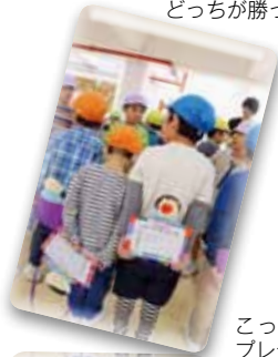
こっそりと作った プレゼント♡