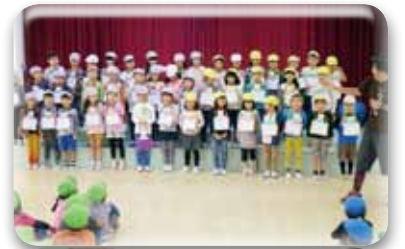
プレゼントのお礼に歌のプレゼント!