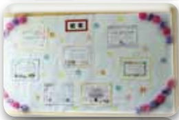
他のオイスカ幼稚園から お祝いのメッセージ♡