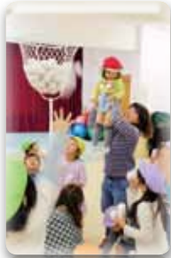
玉入れ大会!! どっちが勝ったかな~?