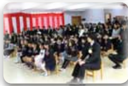
さすが、もうすぐ1年生! しっかりかっこよく座っています!