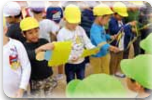
年少、年中さんが作ってくれた時間割表。 大切に使ってね♡