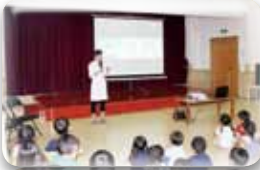
歯医者さんが来てくれました！

6月4日～10日は、歯と口の健康週間! いつまでも健康な歯を保つために、歯医者さんをお招きし、“歯”について教えて頂きました。