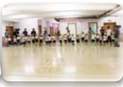
お父さん、いつもありがとう！大好き♡