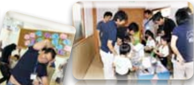
くるっと回って...う~ん！！