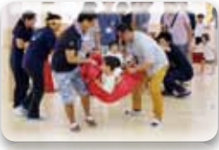
力持ちのお父さんに運んでもらったり~