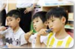
虫歯にならないようにしっかりみがこうね♪