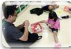
年少さんは、お父さんやお母さんとゲーム大会！たくさん汗をかいた後は、牛乳パックで、お散歩カーを作りました♡