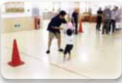
風船をお父さんと運んだり~