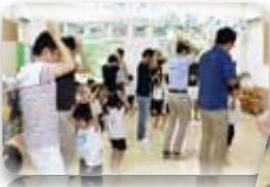
みんなでうさぎに変身！！

6月17日は父の日。幼稚園では父親参観がありました。この日は、大好きなお父さんやお母さんと一緒に体を動かしたり、製作をして楽しみました！