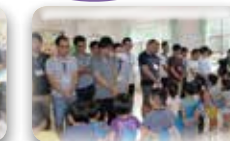
プレゼント、ハイど〜ぞ!