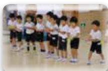
誰が一番飛ぶかな?