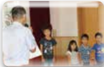
歯について色々 教えて頂きました!

6月4日は虫歯予防の日。しろもとデンタルクリニック様にお越し頂き、 歯磨き指導と歯科健診をして頂きました。