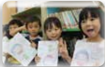
これから歯科健診!!