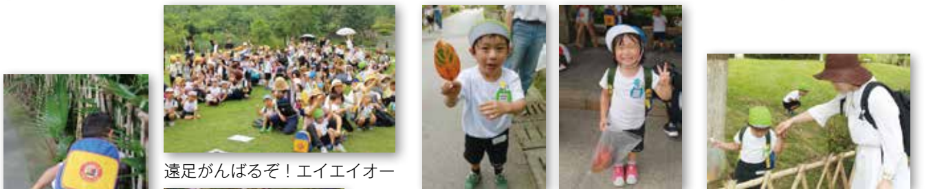
遠足がんばるぞ！エイエイオー