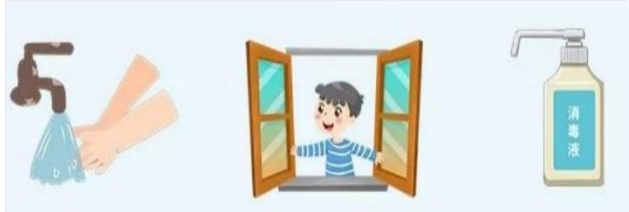
【図表3：一般家庭での消毒方法】