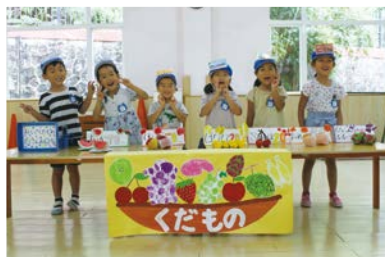
あじさい組:くだものやさん