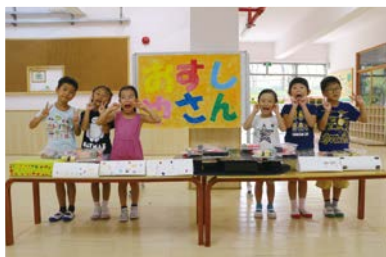
ゆり組:手作りの回転台つきおすし屋さん

9月24日におみせやさんごっこを行いました。各ご家庭から集めた様々な廃材を利用しながら、自由な発想で沢山の工夫が詰まった商品を作ることができました。当日は、全店完売となり嬉しそうなお子たちでした。