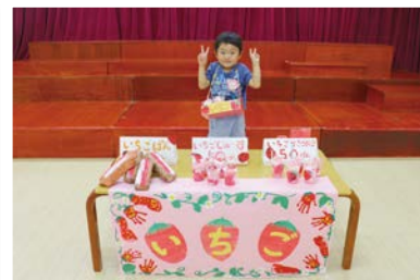
もも組:いちごやさん