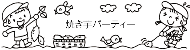
焼き芋パーティー

明けましておめでとうございます! 2021 年も子どもたちと新しい体験を積み重ね、 元気いっぱいの毎日を過ごしていきたいと思えます。本年も宜しくお願い致します。 さて、今回は「歯科検診」、「焼き芋パーティー」、「お餅つき会」の様子をお伝えします。