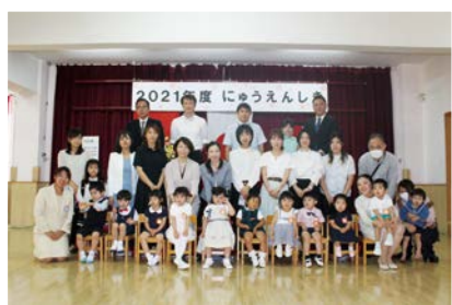
つくし・ひまわり組