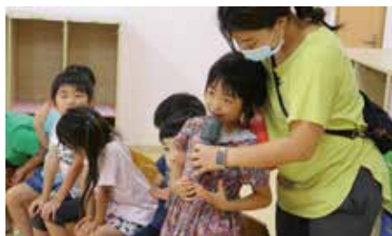
ちょっぴり恥ずかしいな・・・というお友だちでしたが、頑張って英語で話してみたらとっても上手!