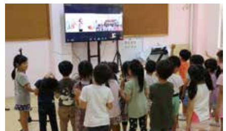
最後はシェリー先生に“Good b y e ~”みんなで新たな一歩を踏み出しました。今後も楽しんでいこうね♪