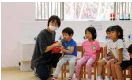
音楽が止まった時にボールを持っているお友だちは、マイクを使って“My name is ○○”と答えました。