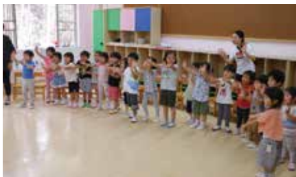
シェリー先生とはじめての英語☆ みんなで“Hello!!”のごあいさつ!

今年度から中国語あそびに加え、新たに「英語あそび」が始まりました。オイスカ上海の英語教諭とオンラインで繋ぎ、初回は“My name is ○○”をテーマに、ゲームや歌を交えながら楽しく英語に触れる事ができました。「楽しかったー!」と話す子どもたち。今後も子どもたちが自発的に学べる環境を整え、楽しみながら活動していきたいです。