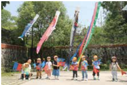
つくし・ひまわり組

5月5日の子どもの日に向けて、こいのぼり製作を行いました。学年に応じたこいのぼり製作に取り組み、個性豊かな作品が完成。その後は園庭の大きなこいのぼりの前で記念写真を撮りました。これからもすくすく元気に育ってね。