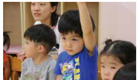
先生にお名前を呼ばれたら手を挙げて“Here!” 英語のアクセントで呼名されるので、真剣に聞いています。