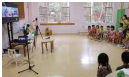
笑顔が素敵なシェリー先生は、ほぼ英語のみで進めていきますが、こどもたちは内容を理解し、とても楽しそう♪