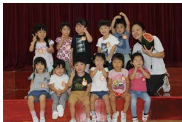
つくし・ひまわり組

8月26日にすいか割りを行いました。全学年で「エイ・エイ・オー」と気合を入れ、目隠して前が見えない中、お友だちの声を頼りに合計5個のスイカを割ることができました。すいかが、苦手な子も、みんなで食べたすいかは格別だったようです。